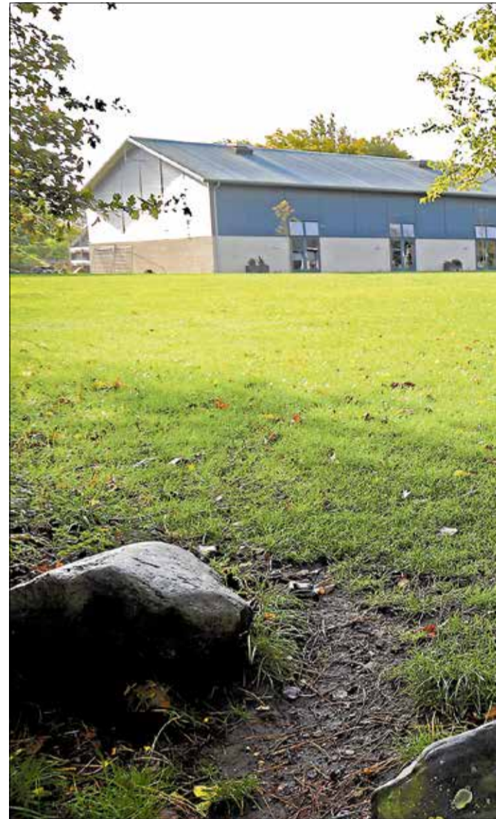
- Med det vi i dag ved om forholdene på Havregården, ville vi gerne have ha-

Medarbejderne beretter igen om grænseoverskridende ytringer fra elever såsom »Jeg penetrerer dig med et kosteskaf« og voldelige episoder, hvor en elev under en konflikt truer til medarbejderne med at ringe efter et tæske-