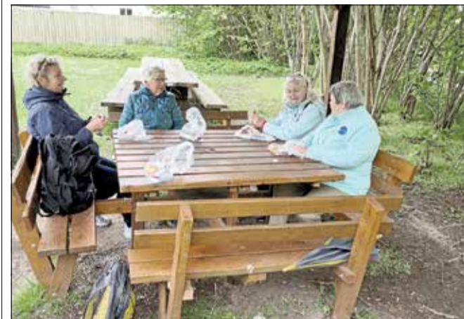
Tema-gåturene indeholder også en pause, hvor arrangørerne byder på en forfriskning.

GRIBSKOV: De kommende uger er der gåture med passion på programmet, når Frivilligcenter & Selvhjælp Græsted i samarbejde med Gribskov Går sammen arrangerer traveture.