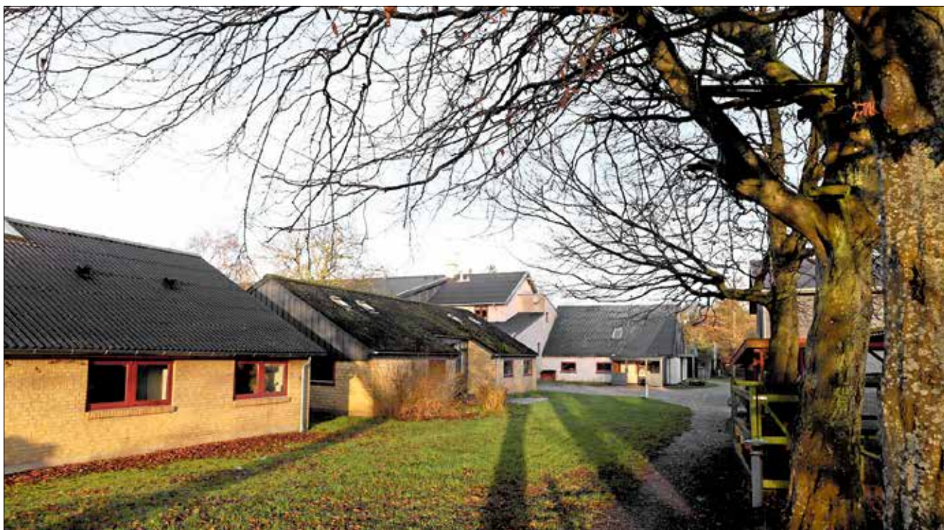
Kostkolen Havregården i Smidstrup lukkede ved årsskiftet efter afsløringer om, at der havde fundet vold, grov mobning, seksuelle overgreb, stomisbrug og selvmordsforsøg sted over flere år.

- De har ansvaret for, at børnene har det godt. De skulle have opdaget, hvad der fore-