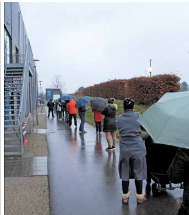
Der var lang kø, da lyntestcenteret åbnede i Gribskov i december. Nu er det ikke længere muligt at få en kviktest i Helsing Hallerne.