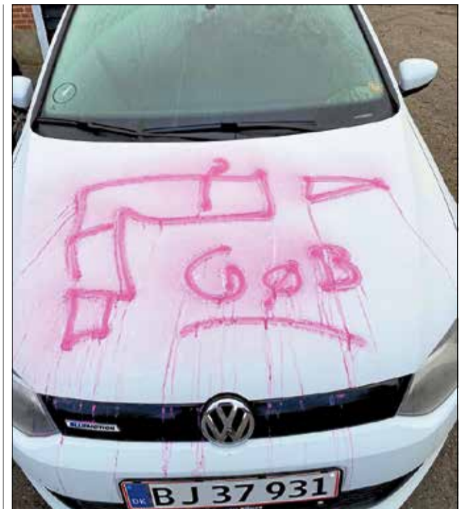
Hærværket i Vejby havde blandt andet ramt flere biler.