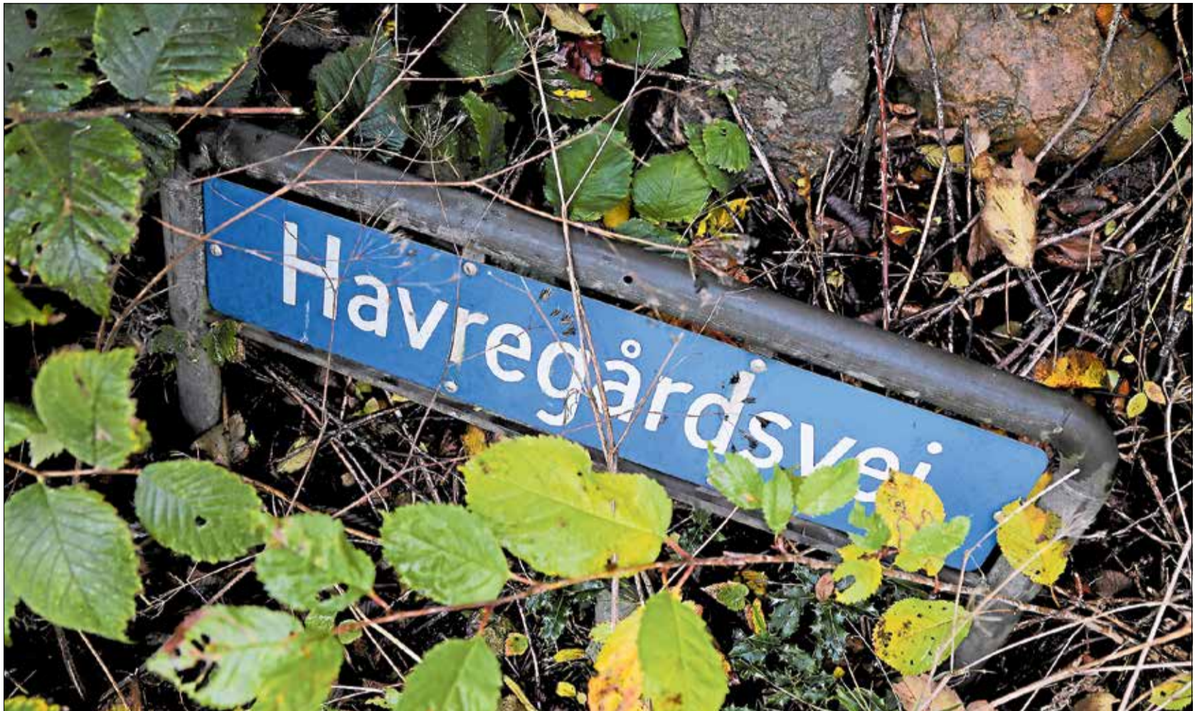
Anklagemyndigheden skal nu vurdere, om der skal rejses tiltale mod Havregårdens tidligere forstander.